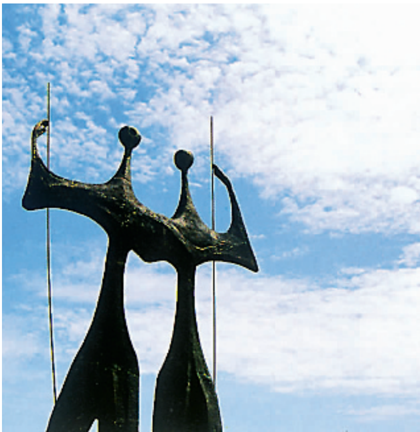
巴西利亚城内的雕塑