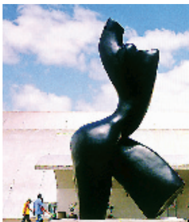
一尊独特的人体雕塑,被俗称为“魔鬼身材”,展示着拉丁妇女肌肤黝黑和曲线的美。

说起巴西,脑海里涌现千万种激情,比如足球,比如桑巴舞。但还有一种激情,到了那里,就明显感觉到城市建筑的激情。就算巴西没有人,光看建筑也能感受到其中的风情。作者将里约热内卢描述成上帝偏爱的城市,而巴西利亚则是地球上的外星城。巴西利亚喧闹的背后是生命的激情和张力,紧张的背后是人性的释放和自由。