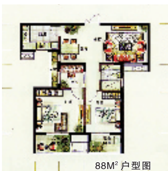
88M 2 户型图

那天是人居展的第一天,饶有兴致地跟朋友在世贸几个展区逛。老远,朋友就指着一幅宣传画说:“闹,那个盘子还不错的。”——我一抬眼,是芳满庭。展位一角,已经有人挤成一堆在填意向表了。不大愿意跟别人抢的我们于是决定:改天单独去看房。