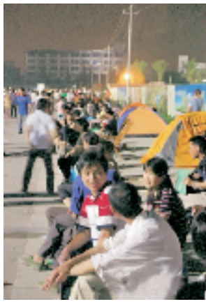
万家花城二期漏夜排队现场

久违的排队抢购,似乎今年特别流行:春运买车票要排队,股市造就了证券公司和银行前长长的队伍。