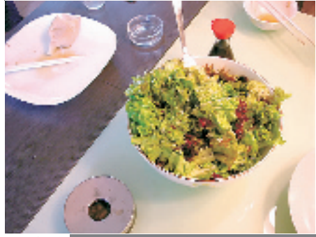
美味佳肴总是以风卷残云之势消失