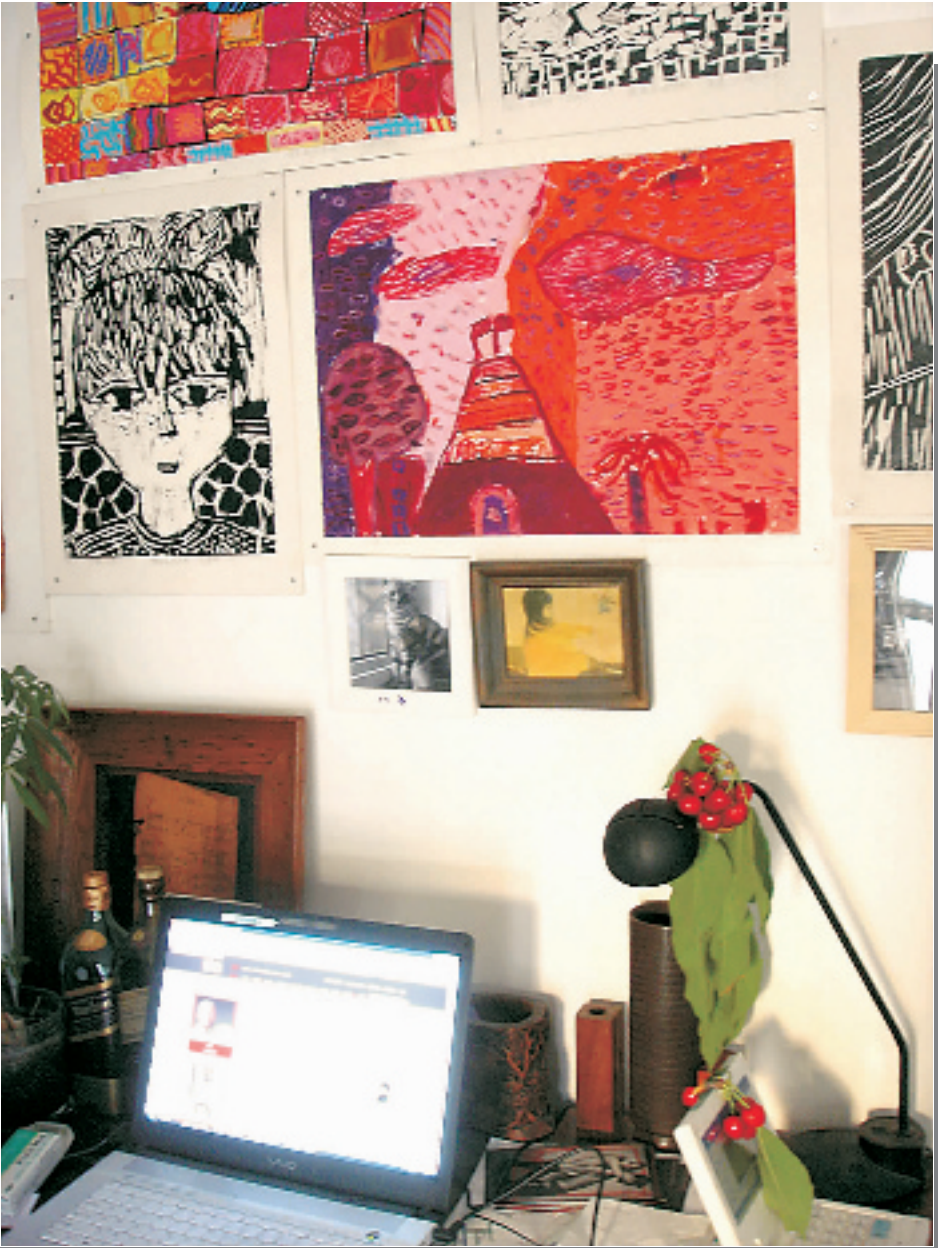
工作台,画墙,和新鲜樱桃