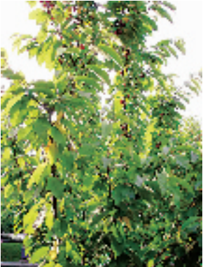
绝对新鲜流口水的大樱桃哇

不管是自得其乐的还是爱管闲事的,不也很欢迎这样爱生活爱写作,偶尔说些我们看来是惊世语而他自己觉得是普通大实话的人吗?