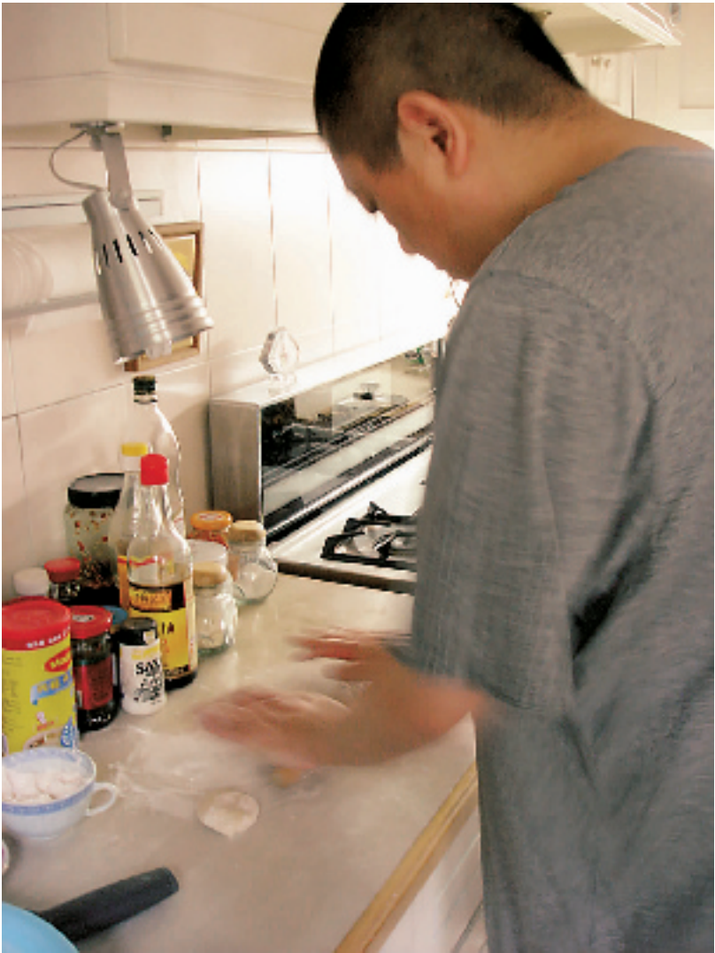
老王的厨艺是在部队里练出来的