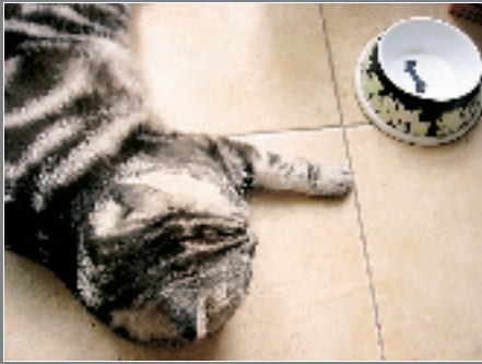
“八不”和它的猫咪碗