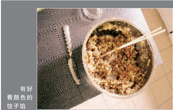
有好看颜色的饺子馅