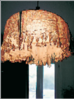
老王独创之格子裤灯罩