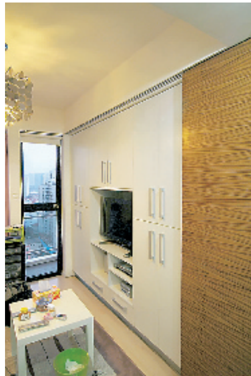
▲左边电视柜,右边是厨房,全靠这扇移门的功效啦!