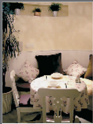
这个客厅能开小型 Party