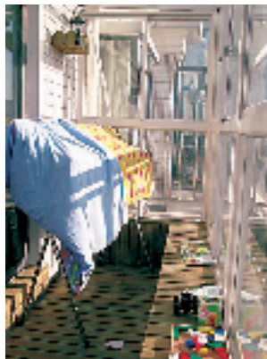
宝宝昨晚“画地图”了,所以……顺便看看阳光露台上堆满的玩具。