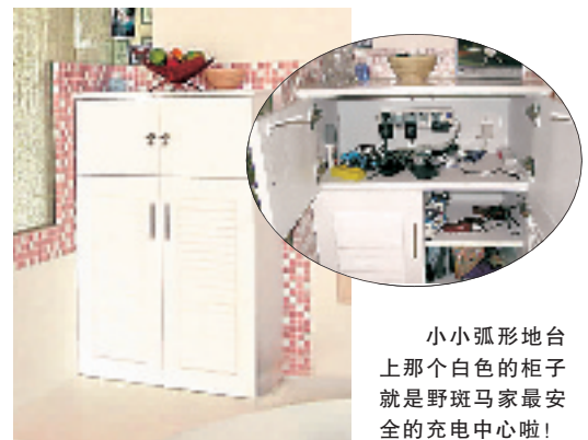
小小弧形地台上那个白色的柜子就是野斑马家最安全的充电中心啦!