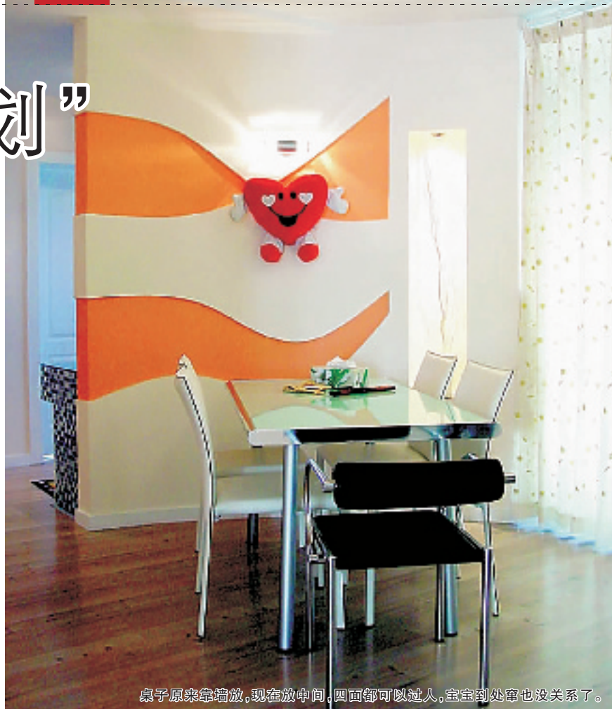
桌子原来靠墙放,现在放中间,四面都可以过人,宝宝到处窜也没关系了。

“对了,还有一点好处,加了玻璃阳光房之后,噪音也降低了13分贝,对孩子的听力也有保护的。”