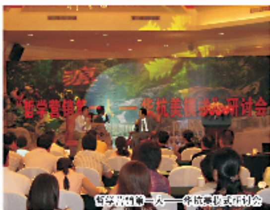
新华社第一次——余杭会议研讨会

炎夏将至，如何度过盛夏酷暑，不同阶层、不同地域、不同人群都有各自不同的嬉水方式，目的虽一，而产生的效果和后果却是千差万别。