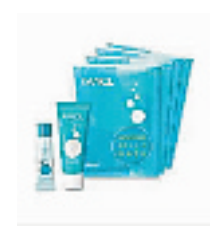
FANCL 去黑头收毛孔特惠套装

混合型肌肤适用, 含泡沫洁面粉 (50g)、补湿液 (30ml) 以及锁水乳液 (30ml)。全是夏天适用的清爽型。