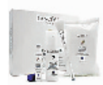
兰蔻智能愉悦美白焕肤礼盒

最新限量发售 41500 个, 含有 FANCL 著名的黑头洁净面膜 (40g)、脸颊保湿啫喱面膜 (4 对)、T 区控油精华霜 (8g)。如果你有黑头烦恼, 选它绝对没错! 黑头洁净面膜只需敷在 T 区 3 分钟后洗掉即可。还能改善毛孔粗大的状况, 减少油脂分泌。