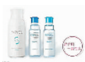
FANCL 柔滑美肌清爽型三件套

内含: 纳米卸妆油一个 (20ml)、洁面粉一包 (13g)、氨基酸洗发香波 (10ml × 5 包)、氨基酸护发素 (10g × 5 包)