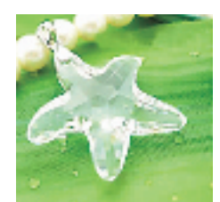
海星造型水晶吊坠

堪称世界上最好的眼膜了, 性质温和不刺激。只需要 5-10 分钟, 等清凉的配方渗入眼部肌肤之后, 疲劳感仿佛一下子就没了。眼袋、黑眼圈、干纹、油脂粒通通靠边站! 长期敷效果卓越看得见!