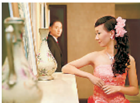
两人的结婚照也是“混搭中式”的