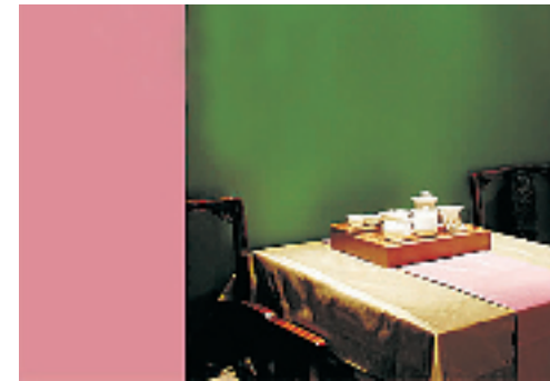
颇受好评的棋牌室