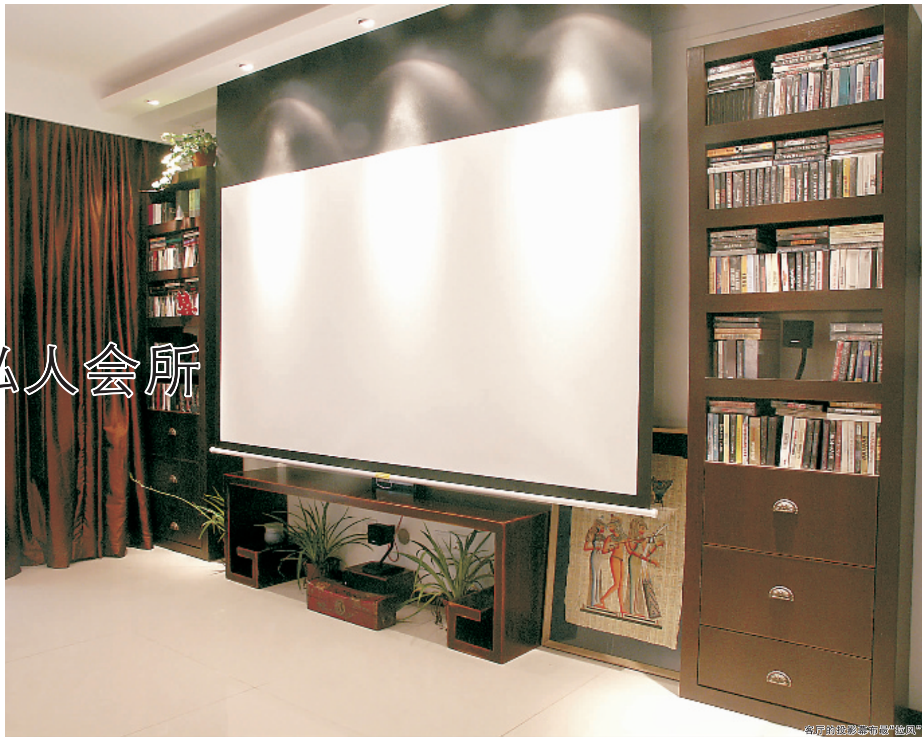
客厅的投影幕布最“拉风”