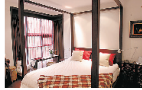
只能在老电影或者名人纪念馆里才能看到的架子床