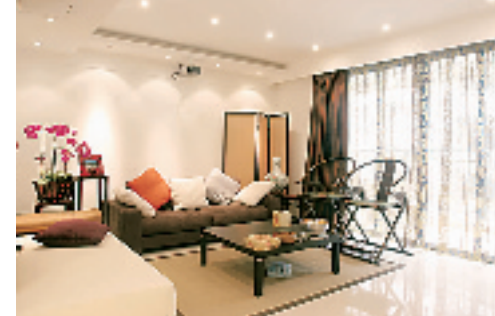
客厅的投影灯、屏风