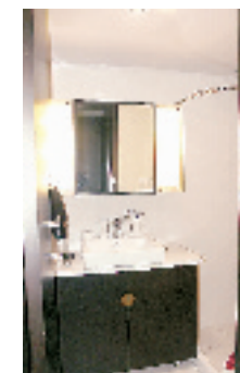
不同风格的两个卫生间