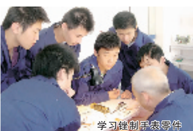
学校理事长和学生在学习控制手段零件