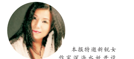
本报特邀新锐女作家深海水妖开设