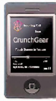
微软 -Zune Phone