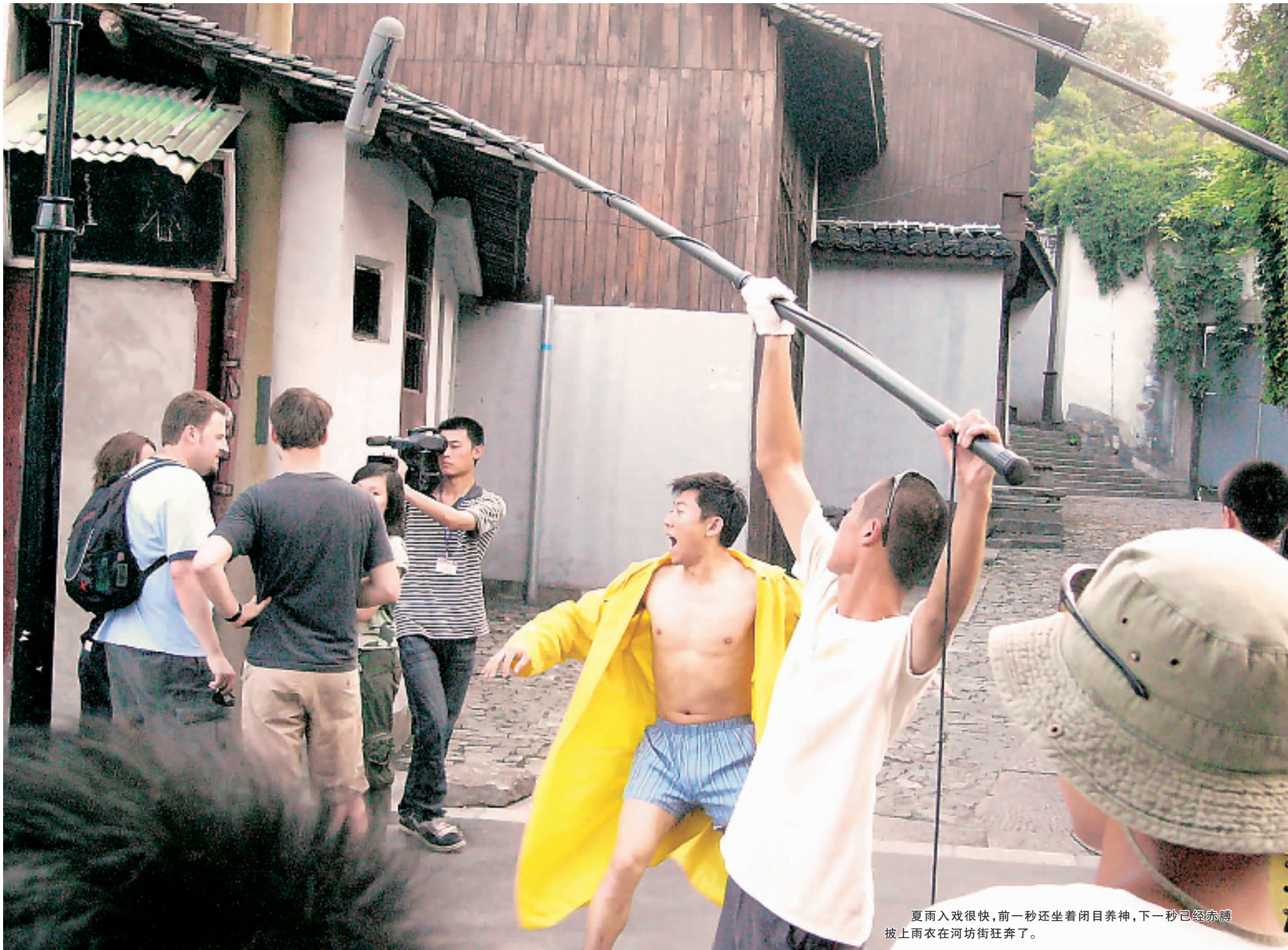
夏雨入戏很快,前一秒还坐着闭目养神,下一秒已经赤膊披上雨衣在河坊街狂奔了。

38度,无风,闷热,只有知了很high地叫着。此种高温天气在家吹空调是件人生多么大的乐事啊。但偏偏就有人看上了杭州,喜欢享受这“新火炉”的洗礼。新城市电影《棒子老虎鸡》就选中了杭州这块风水宝地,全程取景,在这蒸桑拿般的环境下开始了紧张的拍摄。