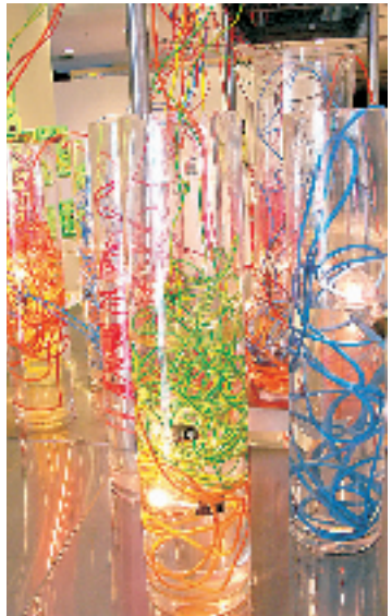
《洪水》:将电灯泡与电线浸入装满水的玻璃容器中,重现人们对于水电混合的恐惧。