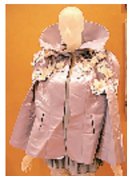
▶《陶气娃娃》:将维多利亚风格的复古服装穿在发光的真人大小陶瓷娃娃身上,用高科技手段激活浪漫情怀。服装的颜色会随着陶瓷娃娃身体热量的变化而改变。