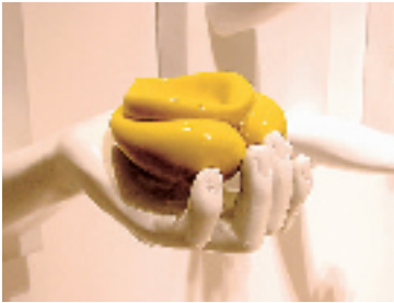
《烟灰缸》:将女人的隐私部位演变成烟灰缸等功能性产品,以立体的形式去表现情色,展现出这个世界上仅有的两个性别的幸福生活,并展现了男人对此的眷恋。

场地的布置让人有点失望,主办方设想让参观的人在自由的空间里去发掘艺术,但由于场地大而分布不明朗,让人对这次展览难以产生强烈的印象,甚至产生了疲惫。另一问题是,很多展品制作得很不完善,非常不坚固。特别是产品类,不供人使用、体验,那产品的意义何在?