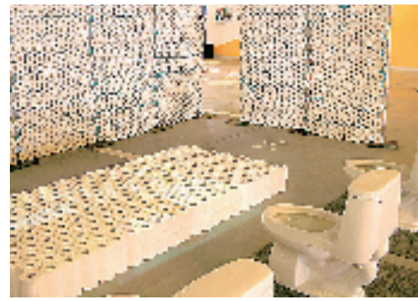
《纯粹设计》:用数量众多的卷纸筒围合成空间,马桶演化成椅子,洗手盘成为桌台,而卷纸上印着展览信息,传统的私密空间成了公共信息的展示交流空间,两者没有界限。