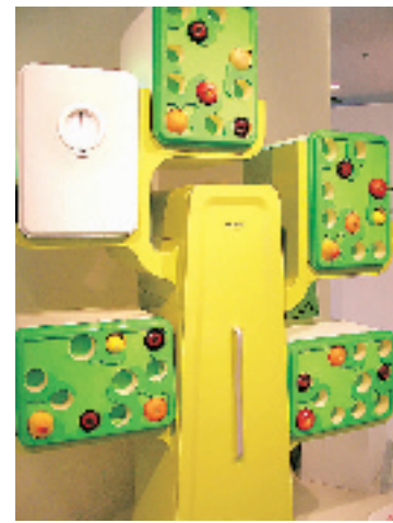
《树屋 2.0》:大胆尝试了家具和电器的融合,打破了厨房和客厅的界限。产品以一棵树的造型出现,树干是冰箱,每个树枝上都有一个独立控制的家电产品,包括独立控温的小冰箱、空气过滤器、榨汁机、烤箱等。如果电器不够多,树枝也可以暂时空缺,充当书架或展示架。