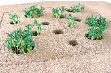
《土》:一系列的桌椅、茶几、窗户都蕴含来自泥土的自然气息,设计师利用特殊材质使这些家具在使用一段时间以后都能长出绿草。