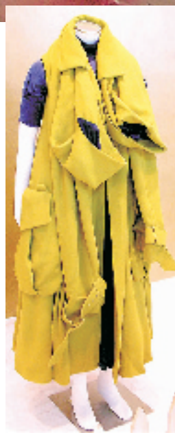
◀2006年底在“兰蔻色彩大赛”中获奖的系列服装。