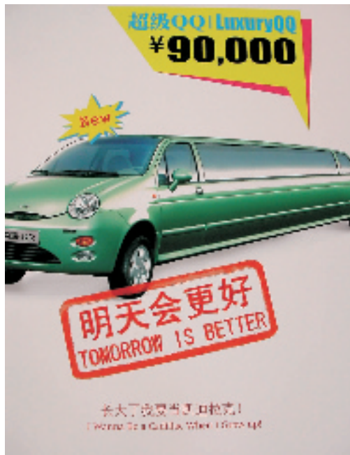
《玩物不丧志》:从购物中心中挑选最具代表性及话题性的品牌,通过改变其功能、属性或与其它品牌杂交的方式来创造设计出新的产品,从而重新诠释品牌和社会产品的意义。