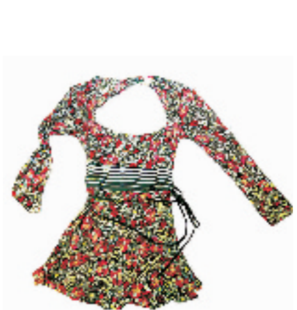
Miss sixty花色长袖上衣。售价1490元,采用莫代尔纤维,不仅保持了良好的透气性,而且质感很薄。