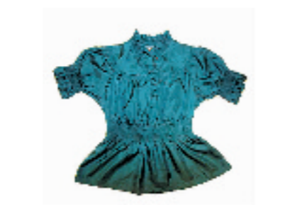
ONLY孔雀绿上衣。短袖上衣,面料有光泽感,收腰设计。售价399元。