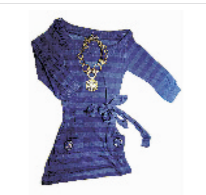
Morgan宝蓝色针织衫。店员说这件衣服是秋装里卖得最好的。衣服上有金属丝修饰,腰际可以系上腰带。售价1078元。