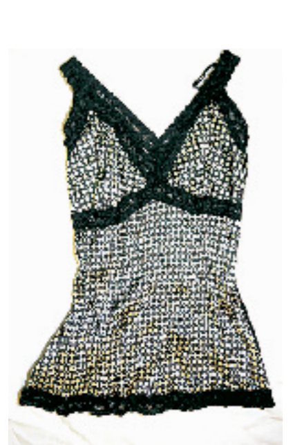
MOTIVI吊带上衣。黑白小格子的吊带上衣很性感,尽显女人味,售价359元。