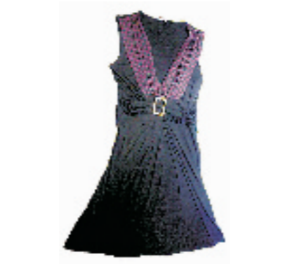
Morgan黑紫两色连衣裙。售价1395元。