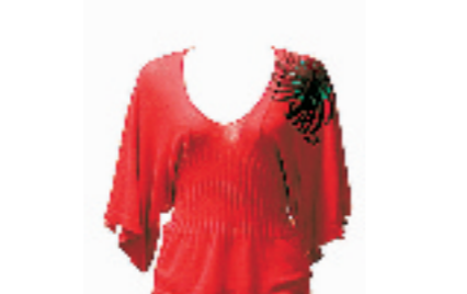
Miss sixty桃红色针织长袖毛衫。含有50%的羊驼毛成分,售价1390元。