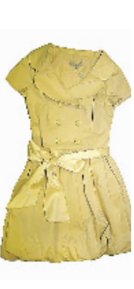
VERO MODA米色连衣裙。刚刚到货的新品,腰际的带子是100%的蚕丝成分。售价599元。