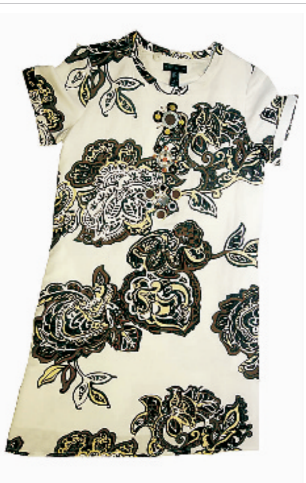
MANGO连衣裙。店员特别推荐的一款秋装连衣裙。面料是亚麻加棉的材料,白色的底色加上大花纹。售价875元。