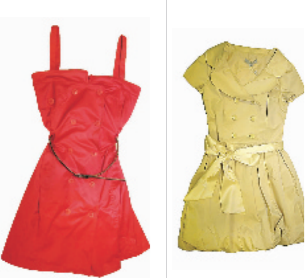
VERO MODA红色吊带长裙。面料很特别,采用了棉和锦纶相结合,保持了棉的透气性,售价449元。