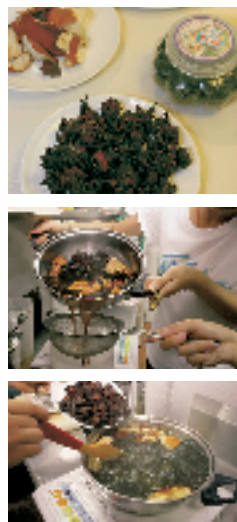
洛神梅子茶制作过程

点评: 端上桌面的芒果沙冰色泽鲜艳,稍稍低下头去,甚至能闻到芬芳果香,原汁原味极其浓厚,不添加任何多余的辅料。醇厚冰凉的芒果味,让我这个不爱吃芒果的人都连吃两碗。当然,要是配上精致漂亮容器,那就更让人爱不释手。