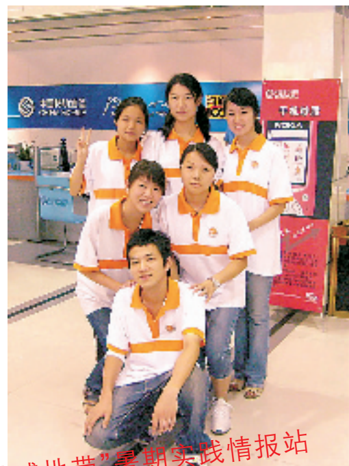
“动感地带”暑期实践情报站