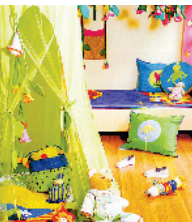
这样的儿童房就是游乐场了