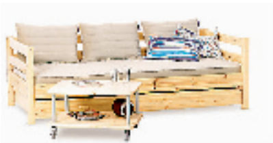
和孩子一起长大的家具