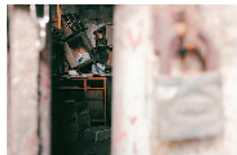
前几天，“无底洞”山下洞口被锁住了，但透过门缝还能看上几眼。