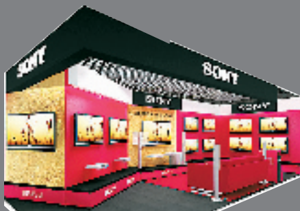
索尼平板体验区，畅享“晶”彩生活