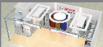
博世冰箱体验区，感受奢华贵族品质