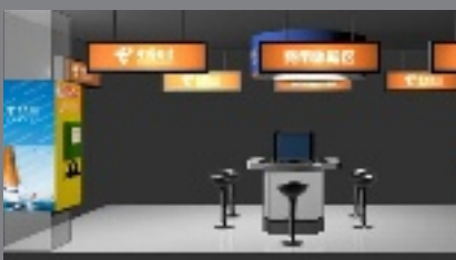
电信体验区，自主体验网上冲浪，享受购物生活