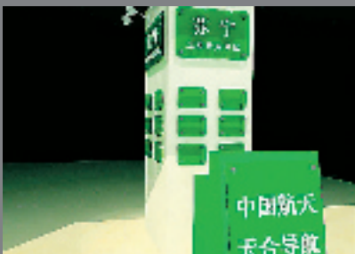
苏宁卫星导航专区，引领时尚，掌控全球