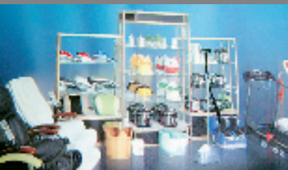
健身中心，苏宁做有品质的电器，购物苏宁过有品位的生活