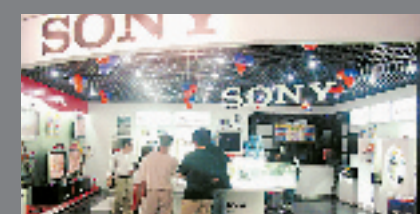
索尼 SIS 体验店，全方位的数字影像体验中心