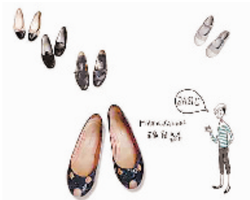
米力的“老鼠鞋”漫画

一种貌似老鼠的平底鞋正流行。亮亮的漆皮、平跟、圆圆的鞋头上露出两只小耳朵，两颗黑得发亮的眼珠，甚至还有几根胡须。这个秋天，购物达人们满世界搜寻这款长相颇为怪异的鞋子。把老鼠穿在脚上？尽管老鼠的形象跟可爱似乎还有一段距离，却丝毫影响不了达人们的热情。