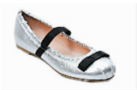
改良版的“老鼠鞋” $2,890 Marc by Marc Jacobs