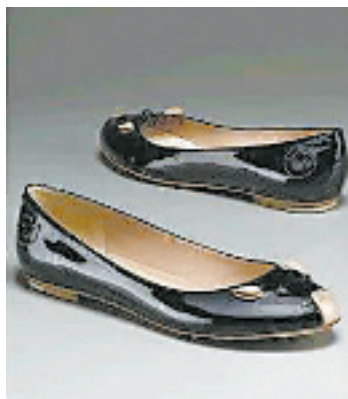
网上转卖的黑色“老鼠鞋”