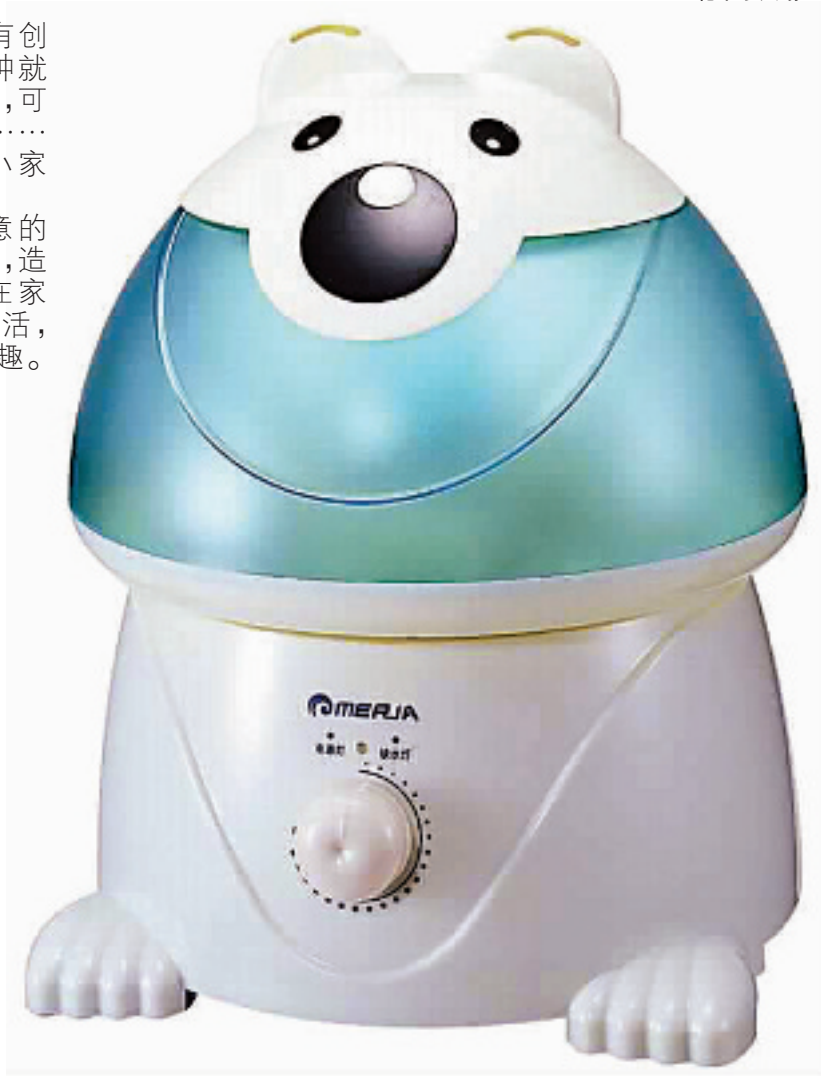
小熊超声波加湿器