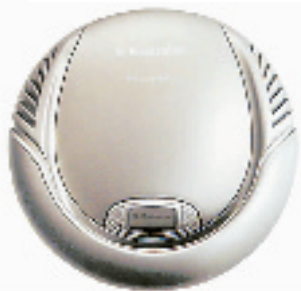
伊莱克斯“三叶虫二代”吸尘器