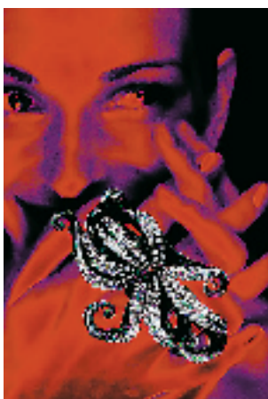
生命X号 2001中意设计交流 - 首饰设计大赛金奖