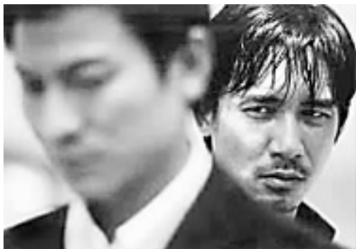
在《无间道》中，刘德华与梁朝伟有了一次面对面的PK机会