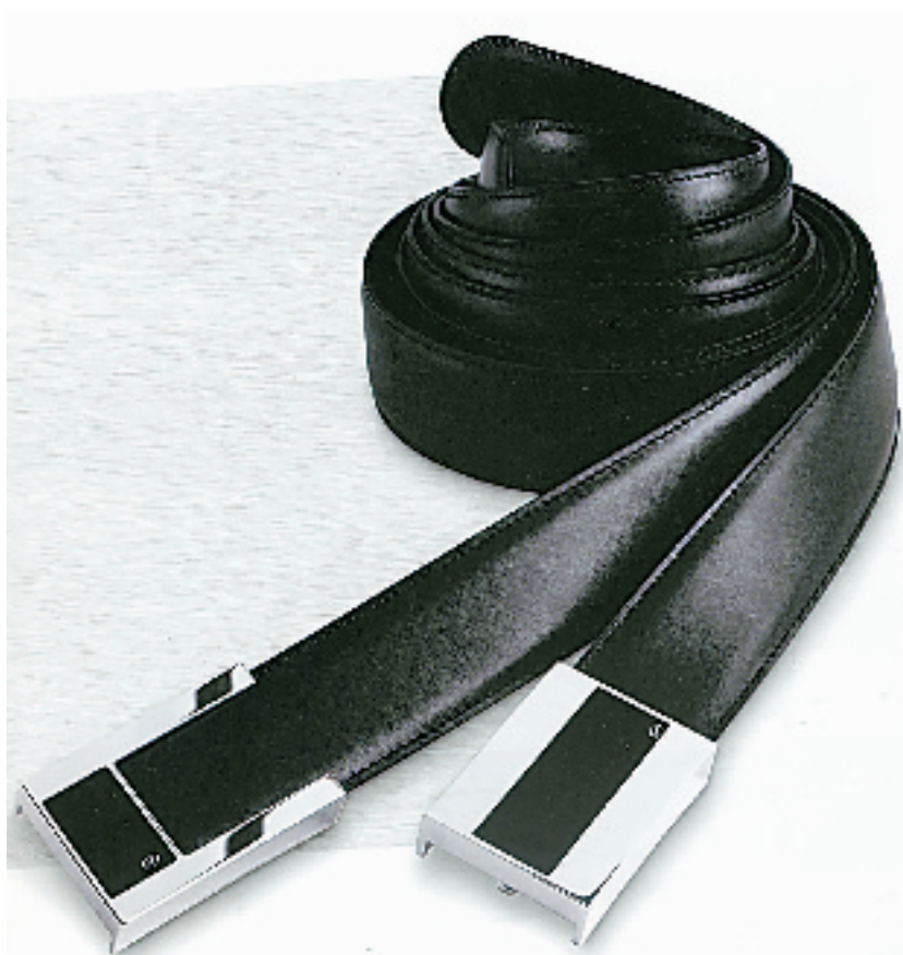
L.T Dupont 皮带

如今男士着装早已不是简单的遮羞御寒，从 20 世纪 80 年代开始，男人们前所未有地关注自己的着装。这些皆因工业机械自动化的推广，给予男人以自我表达的空间，从而使男人从典型的男性角色中获得了解放。男装毕竟与女装不同，无法信马由缰地“看我七十二变”，在款式无法突破的前提下，男人全部的秘密便在于细节。做个细节至上的男人，才是人间正道。