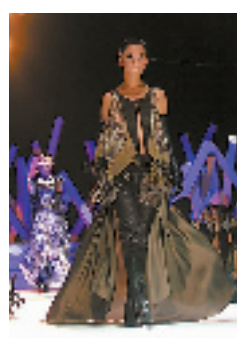
《昔日的软化》现场效果