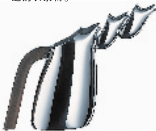
TREBOK 银制的水瓶,上端鸟嘴型的瓶口,倒水的时候,好像是一条小溪轻轻流下。