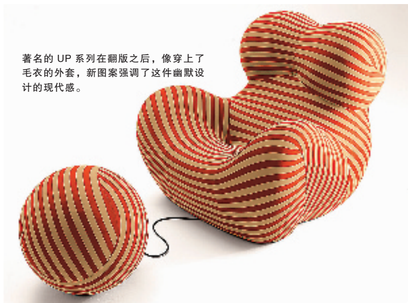
著名的 UP 系列在翻版之后,像穿上了毛衣的外套,新图案强调了这件幽默设计的现代感。