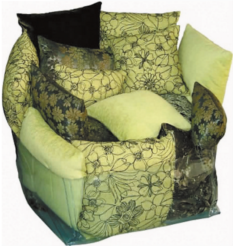
SOUFFLE 沙发其实是用一个底部透明的塑料框架堆出来的沙发,尺寸大小不一的沙发垫被不规则地放在一起,好像是悬空的一样。这是一款非常有意思的沙发椅,可以随意组合,而且底座可以折叠,垫子也可以被整洁地包装起来,非常方便收纳或携带。