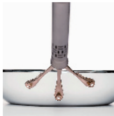
FRYING PANS. LORENZO 平底锅,结构突破了传统的烹饪工具。