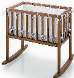
多功能摇篮椅,完全用天然材料制成的摇篮椅,由高条木围挡嵌入四周,给人以大方简洁的感觉。这件家具和这个系列的其他产品一样,灵活多变,非常容易就改造成一个舒适的长条椅。