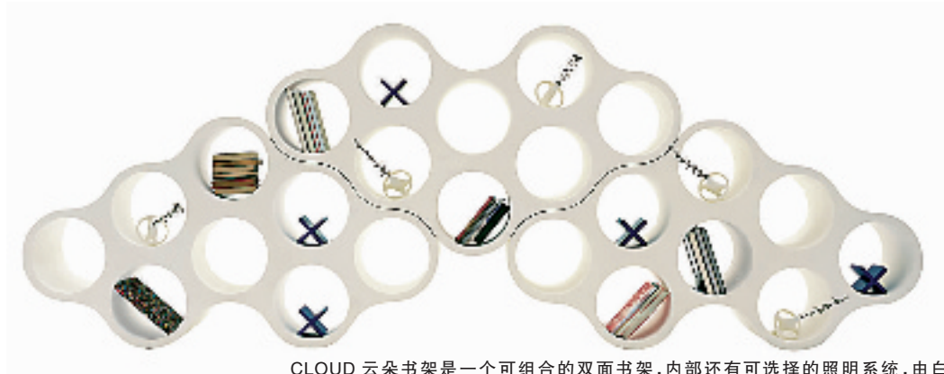
CLOUD 云朵书架是一个可组合的双面书架,内部还有可选择的照明系统,由白色或彩色的聚乙烯制成。由于采用了一次成型的成批制造工艺,只要用两个简单的白色部件就能将多个书架组合在一起。