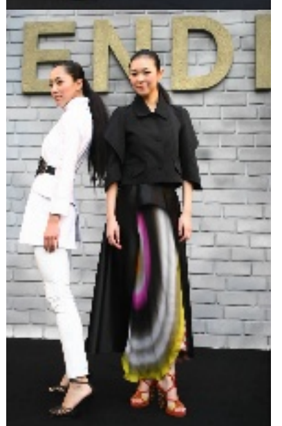
FENDI 长城时装汇演杭州站