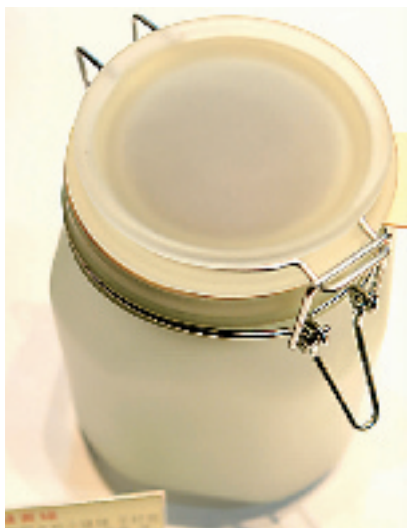
阳光储蓄罐,白天存储日光照射,晚上就可以拿出来照明用了