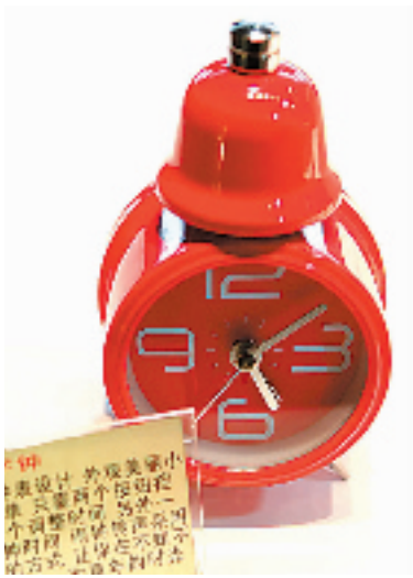
铃铛闹钟,重温小时候的闹铃声