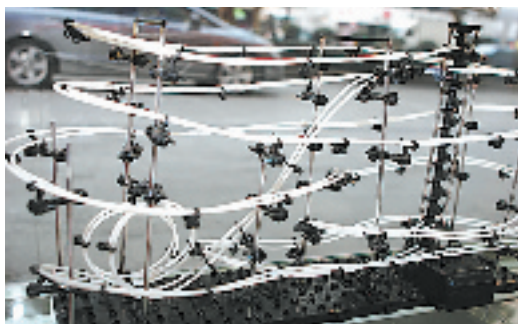
云霄飞车,这是一款可以自行设计,自行搭配的娱乐玩具