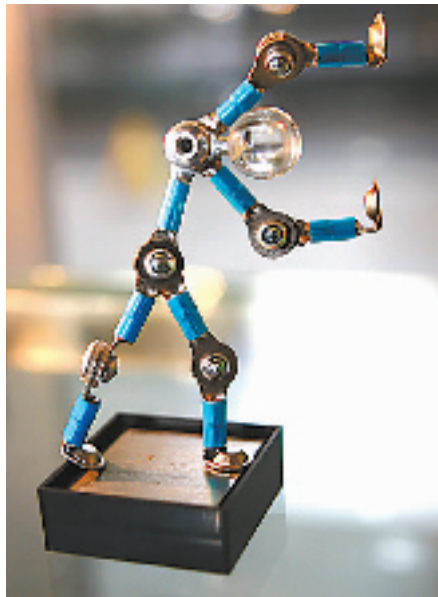
可以随意扭造型的小人