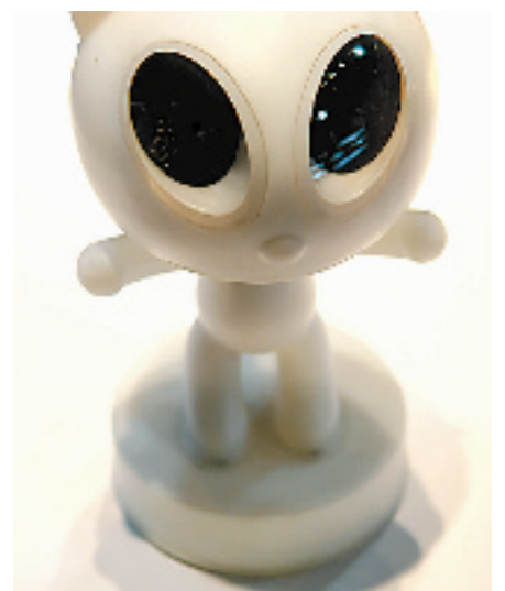
魔力猫桌钟,能换 12 种颜色灯光,并且有助于睡眠