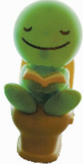
太阳能摇头公仔,利用太阳光能转化成热能,从而可以自动摇头摆尾