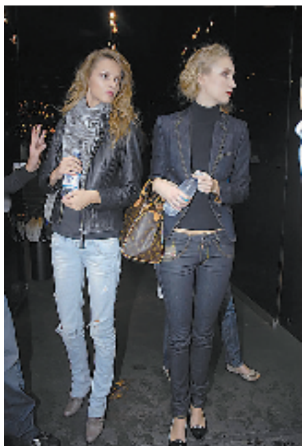
街头常见的经典搭配