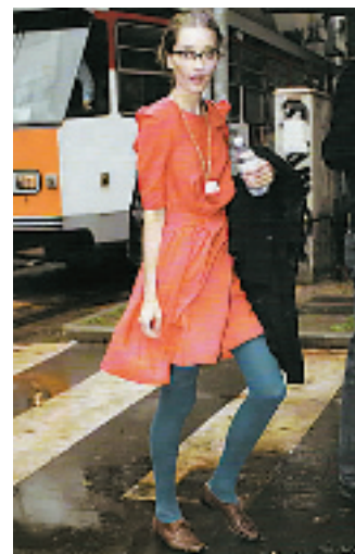
Gemma的这一身有复古的气质里,谁会想要用这样的T呢?