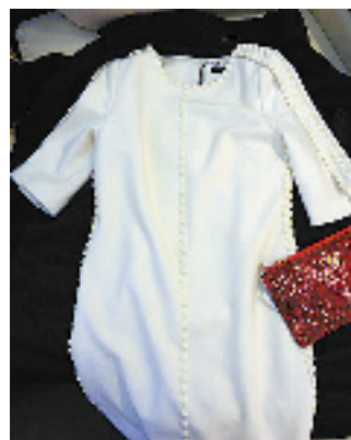
白色的呢料中袖连衣裙，有没有一点香奈尔的味道呢？