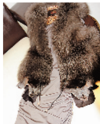
灰色小礼服搭配同一色系的皮草背心，高贵的感觉就是这样营造出来的。