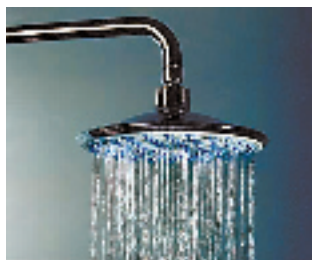
高仪瑞诗沃头顶花洒