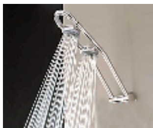
高仪富丽汉达花洒