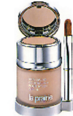
La Prairie鱼子酱粉底连遮瑕膏