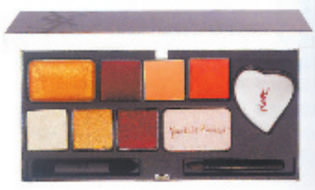
YSL多功能缤纷彩妆盒

Guerlain 娇兰金沙飞舞喷雾散粉: 光听名字就觉得特别梦幻,喷物型的散粉,其实用起来也还方便的,只需要在露出肌肤的地方和香水一样喷洒,脖子,锁骨,甚至发梢。售价:690元