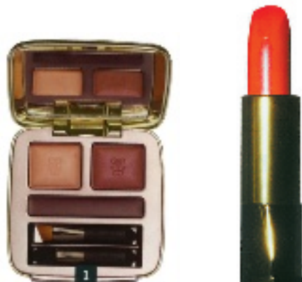
娇兰金钻靓彩三色眼影盒