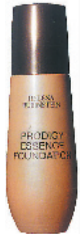
HR极致之美精华粉底乳液