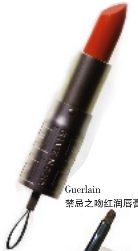
Guerlain禁忌之吻红润唇膏