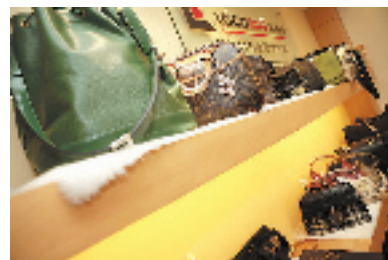
小店里放满了名牌包包