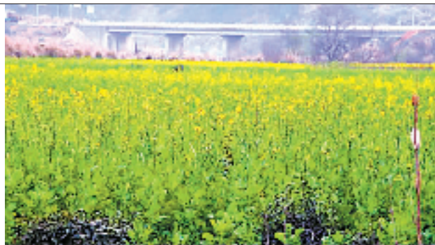
3月12日拍的婺源杂交油菜