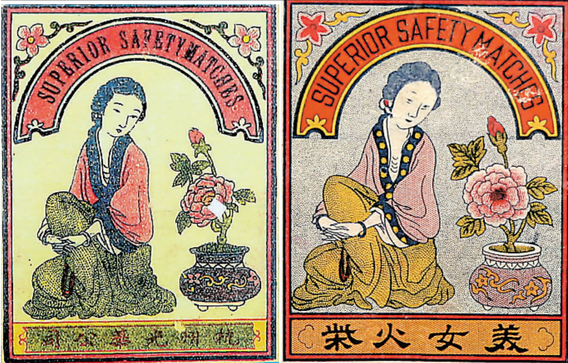
清末的两组古装美女火花。就算把火花放大这么多倍,光凭画面能看出哪种火花最早吗?左边的火花比右边早。