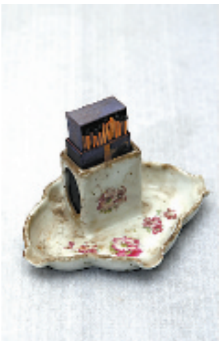
早年的陶器烟灰缸