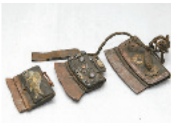
用火柴之前,用“火镰”打击石头取火