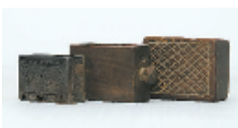
装火柴的专用盒子,有木盒、铁盒两类