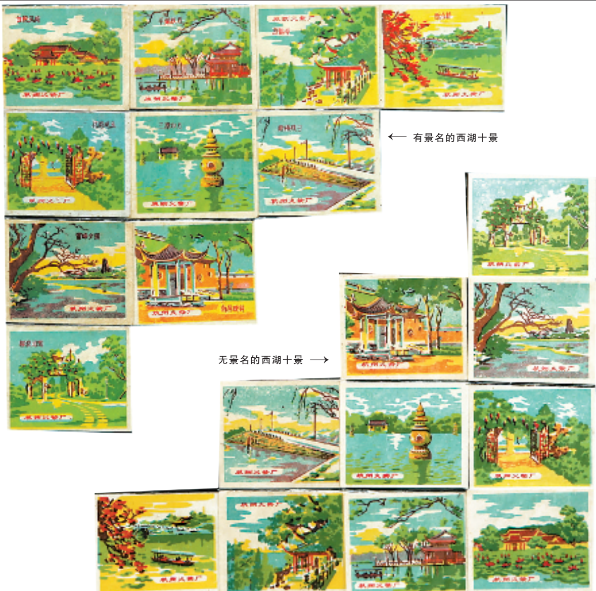
无景名的西湖十景 →