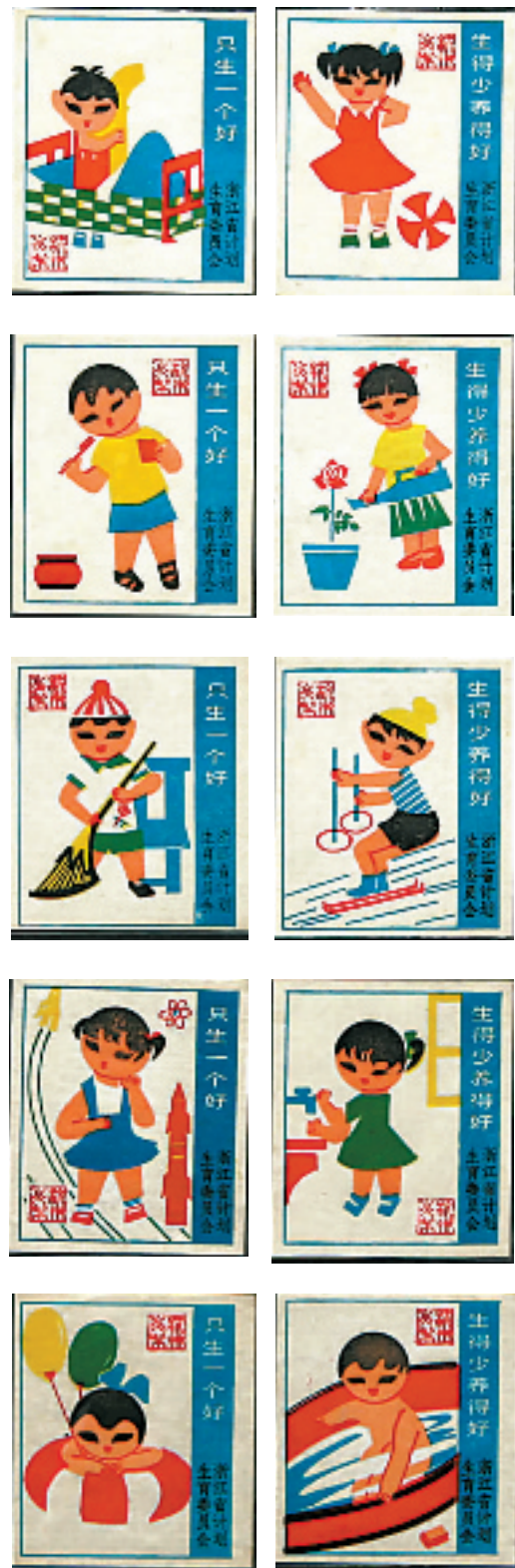
宣传计划生育的火花,口号非常有时代特色。