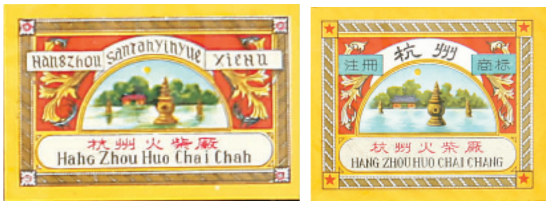
这组火花有个故事,先是出了十二星的三潭印月(火花的四个角),当时有人说十二星是国民党的标记,后来改成了五角星。