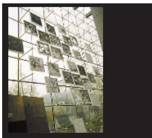
《墨痕》 此作品则堪称大手笔之最,60块80×80×10cm的装置从天花板交错悬挂到地面,好像黑白的千层饼凌空散了一屋子。