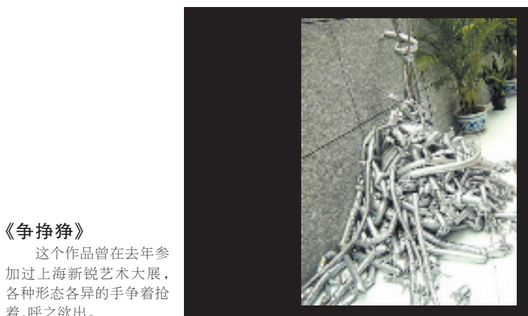
《争争争》 这个作品曾在去年参加过上海新锐艺术大展,各种形态各异的手争着抢着,呼之欲出。