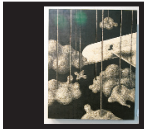
《木板画》 这是一组没有名字の木版画作品,却引来众人驻足讨论。大家讨论它的意思,讨论是飞机破坏了天空还是云朵阻碍了飞机……

《椭圆系列》创作灵感来源于作者对童年生活的记忆。讲述如今的自己冷静地窥视着儿时的世界,仿佛已成为陌生人欣赏着自己童年的照片,而当旁观者转换为当事人时便走入了另一个世界,自己的世界。这种转换无时不在,无处不在……数码图像也正在完成这种转换,成为表现作者内心真实、传达现实图像的媒介。