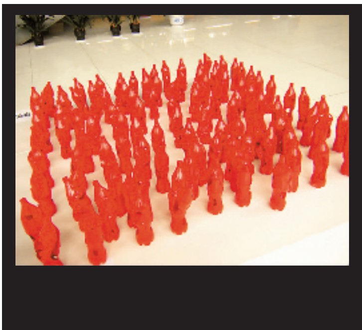
《可乐》 此作品全是由一百多个喝剩的可乐瓶制成。

在西湖博物馆的展厅中,三组雕刻系的作品一下子把人吸引。 学生们在选材上很环保很节约,除了木雕泥塑这些传统工具,往往拿一些钢丝、铜板、麻绳、废印刷纸这样的材料化腐朽为神奇。