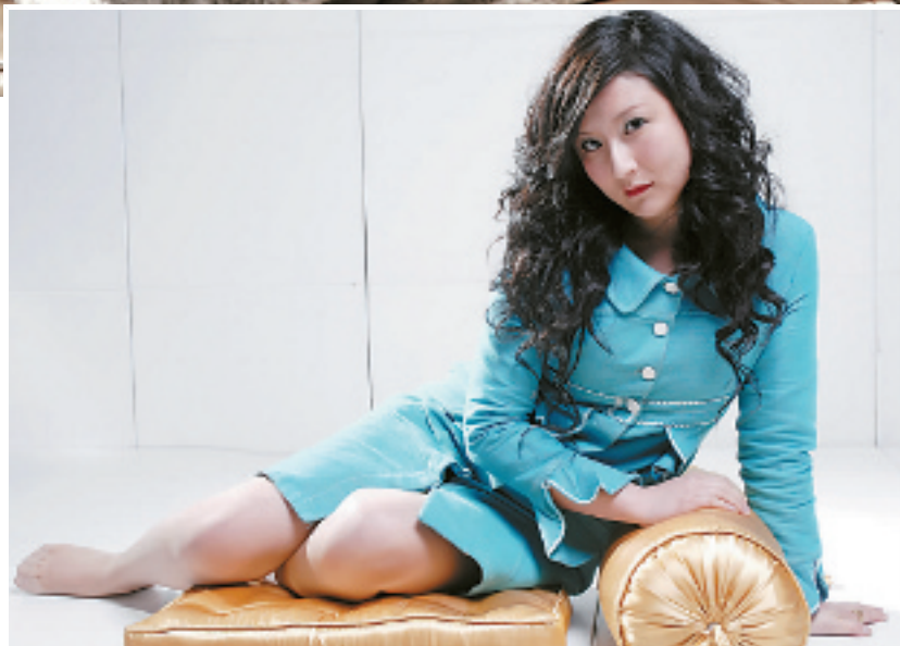
▶ CC 公主