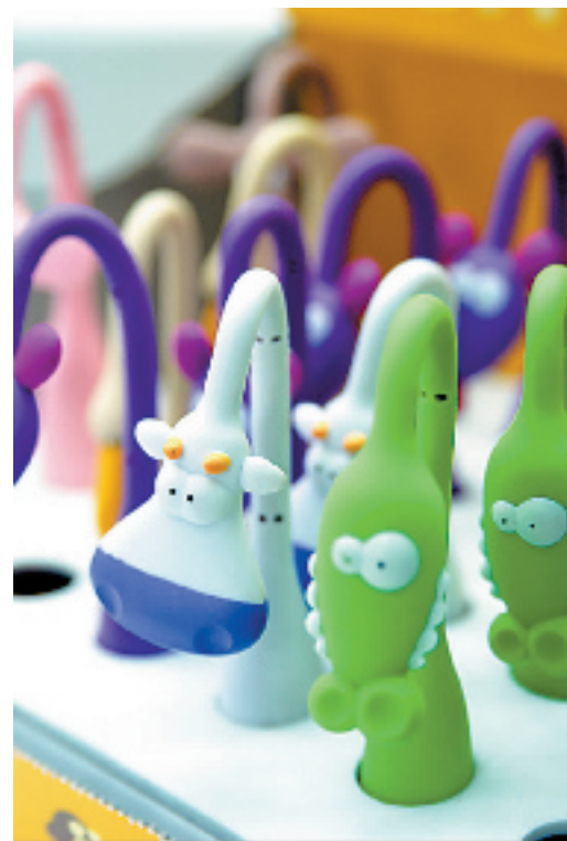
脖子会拐弯的圆珠笔 10元

摄影师赶紧给她留了影。老板娘越拍越开心,陪我们凹造型凹了很久。后来,我们刚走没多久,老板娘就打来电话,叫我们赶紧把照片传给她,说这件衣服已经被人买走了,没得看了。