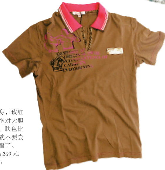
咖啡色的衣身,玫红色的翻领,绝对大胆的色彩搭配。肤色比较黑的男生就不要尝试这样的衣服了。 咖啡色T恤:269元 品牌:Cabben