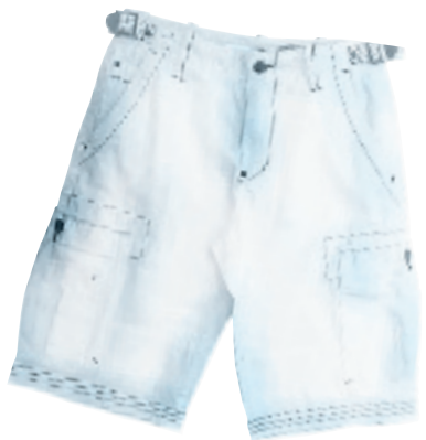
宝蓝色,2008年最流行的颜色之一。宝蓝色跟黑色的搭配会显得更加精神,下面穿一条白色的裤子使整个人都提亮了。 蓝色和黑色相见的条纹T恤:295 白色牛仔短工装裤:425元 品牌:Mark Fairwhale