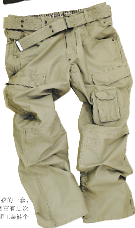
很适合阳光大男孩的一套,层叠的搭配非常富有层次感。多口袋的阔腿工装裤个感觉更加休闲。 黄色T恤:125元 深军绿色背心:165元 卡其色工装阔腿裤:595元 品牌:ESPRIT MEN