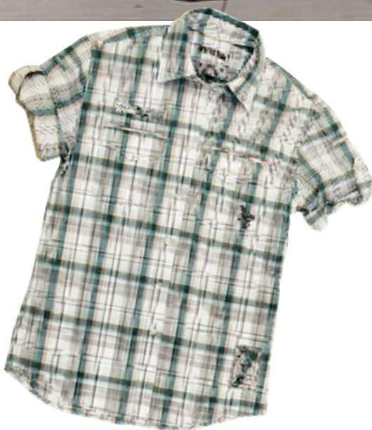
乖乖男孩的首选,格子就是这么学院派的感觉。 格子衬衫:368元 品牌:River stone