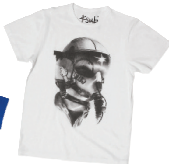
Lane Crawford subi 头盔人像图案 tee $200

除早几年 Undercover 的溶解 tee,当下主导是 slogan tee 与 print tee,上年被 Henry Holland 带起的 slogans 热抢了风头,今季 print tee 再发动攻势,泛滥 08 春夏时装界。