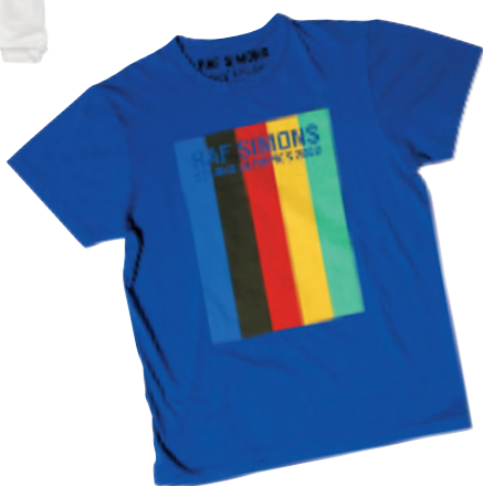
Lane Crawfordaf Simons 蓝色奥运直纹彩 tee $200

鲜有推出联名合作企画的连卡佛,这次找来 4 位极具叫座力的时装单位合作,红透半边天的坏孩子 Alexander McQueen、荷兰双人组设计师 Viktor & Rolf,最当时得令的 Raf Simons,与极速上位的澳洲品牌 Ksubi,分别设计出 4 款共 12 色的 T 恤,全部只售 $200。四个设计单位的作品各有风格,剪裁尺码倾向中性。限量 tee 5 月初将于连卡佛独家发售,200 元买到名师手笔,怎么可以不买?