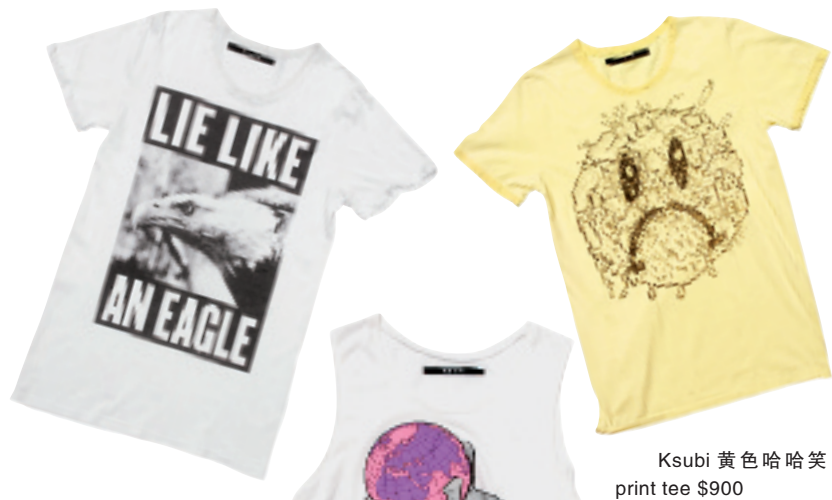
Ksubi 英文字母 eagle print tee $900