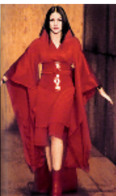
1999 年在格林美颁奖礼上的日本艺妓造型