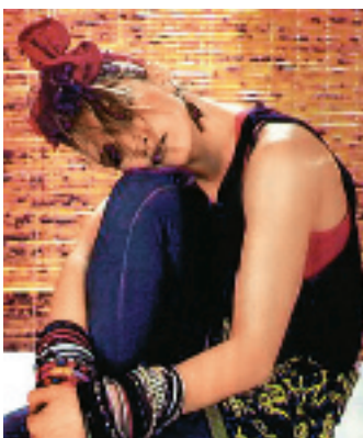
初出道的 Madonna, 堪称是 80 年代的 Fashion Icon

Versace(范思哲妹妹)设计的春夏系列拍摄广告照,虽然毁誉参半,但的确给时装界带来极大影响。不过最瞩目的,要数去年与 H&M 合作推出的“M by Madonna”系列,令其在时装界的影响力倍增。今年 2 月娜姐被《Elle Style Awards》选为“World's top Fashion Icon(全球顶级潮流指标人物)”。