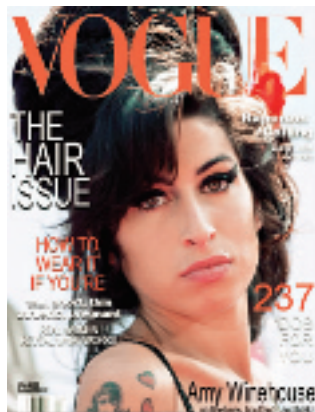
2007 年 9 月美国版《Vogue》以 Amy 作封面人物, 而 08 年 2 月法国版《Vogue》则以 Amy's style 作 styling 主题

度。美国版《Vogue》的总编就被 Amy 的朴素与古怪的风格所吸引, 令她成为 07 年 9 月美国版《Vogue》的封面人物; Roberto Cavalli 也高调宣布向她提供服装赞助; Julien MacDonald 更钦点 Amy 为其 08 秋冬伦敦时装周担任首席模特; LV 则以 100 万美金酬劳邀她担任巴黎时装周的派对表演嘉宾。如此人气爆棚, 今年更将顺势推出个人品牌服装和化妆品系列, 让天下万千仰慕她的粉丝可以照办模仿。