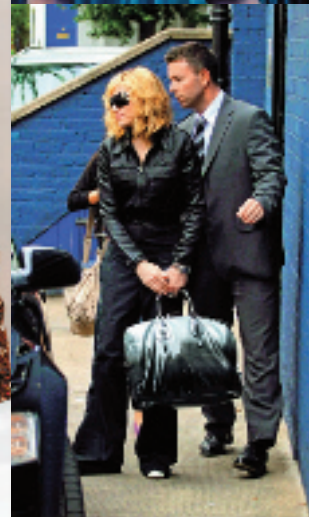
娜姐连续几季都穿 Prada 上身, 令 Prada 稳占 itbag 榜首位置