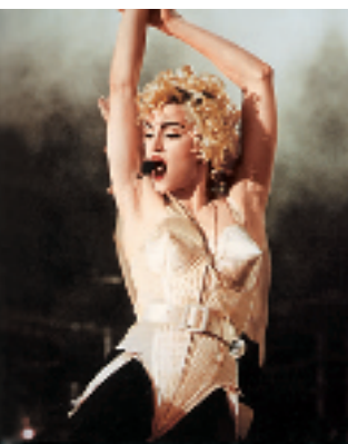
1990 Madonna 世界巡回演唱会穿的金色雪糕筒束腰