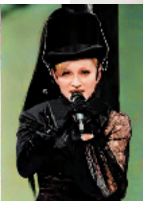
2006 年世界巡回演唱会的骑士造型