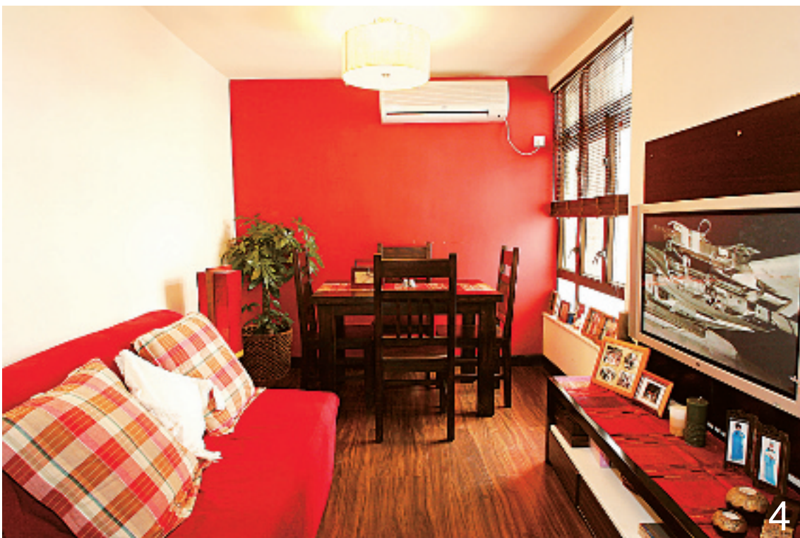
户主:Star 建筑面积:约 50 平米 户型:两室两厅 装修花费:约 20 万元