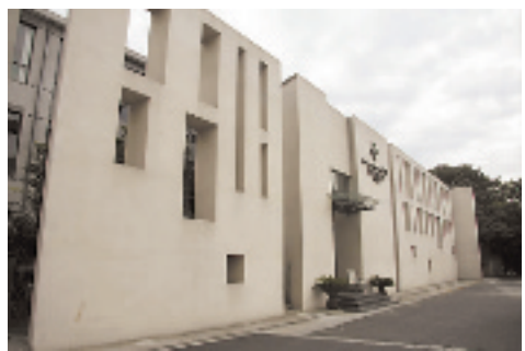
原杭州开元中学重新设计,现为西湖创意谷