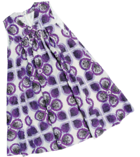
By Malene Birger 紫色图案缀蝴蝶结背心裙 $2,650