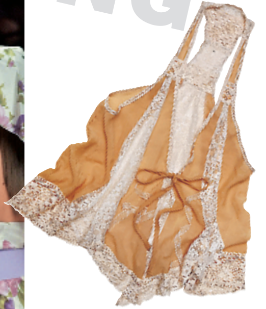
杏色蕾丝边绑蝴蝶结背心外衣$578