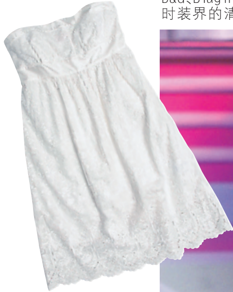
Ted Baker 白色棉质暗花连身裙 $700