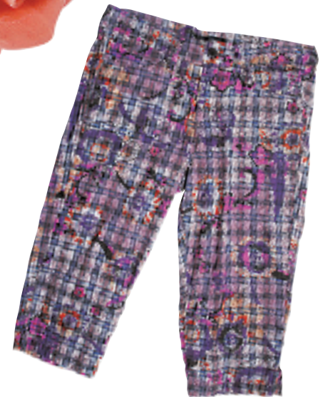
Zucca 花花格子图案中裤 $2,399