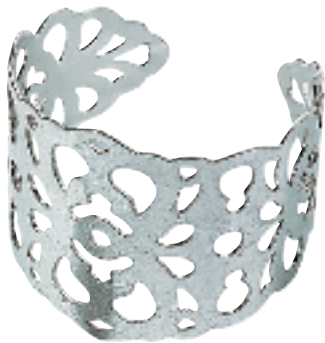
通花图案银色手镯$298