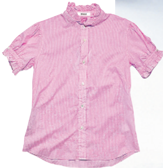
Zucca 粉红色条子恤衫 $1,899