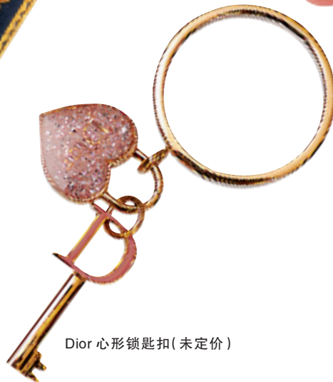
Dior 心形锁匙扣(未定价)