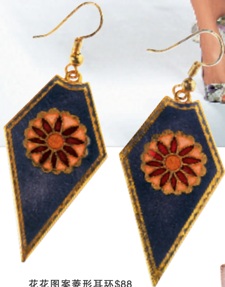
花花图案菱形耳环$88