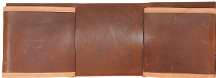
Anna Vince 啡杏色大蝴蝶结发夹 $2,990