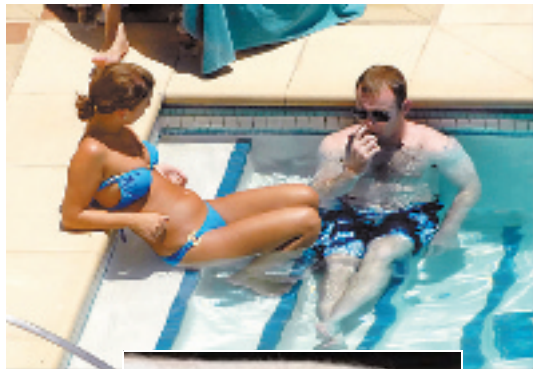
刚成婚的鲁尼和老婆科琳