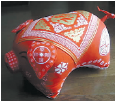
年前组织团购了 100 多只的猪抱枕