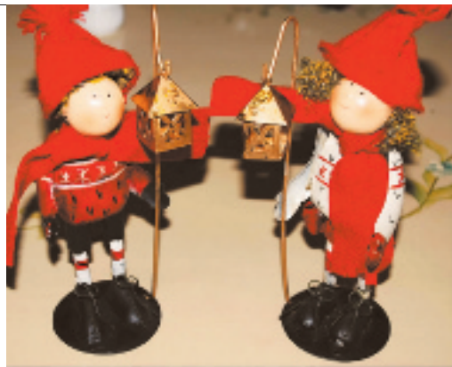
女孩子都喜欢的铁皮娃娃