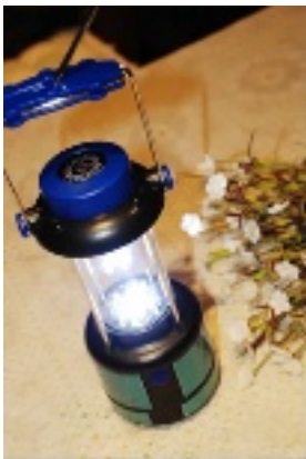
商场里卖 100 的户外灯，市场里 50 搞定