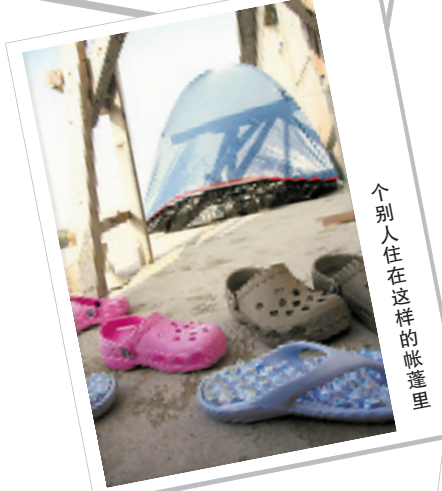
个别人住在这样的帐篷里