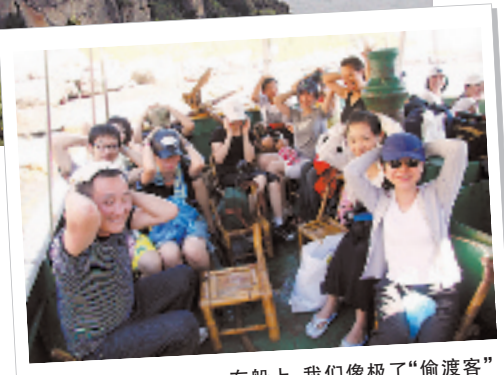
在船上,我们像极了“偷渡客”