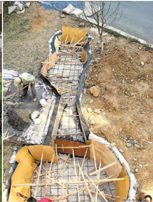
棋棋鸟家的花园装修前后,她说,这可是充分发挥了土八路的吃苦精神