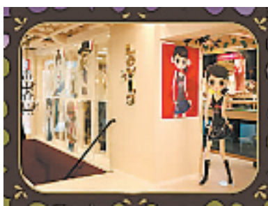
Alice chan 与 LEVI'S 合作