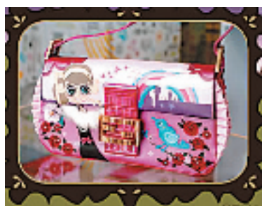
Alice chan 与 FENDI 合作