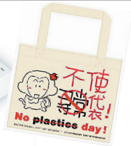
国内插画师胖兔子粥粥与厂商合作的环保袋