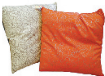
德国插画设计师 MARA 的涂鸦靠垫